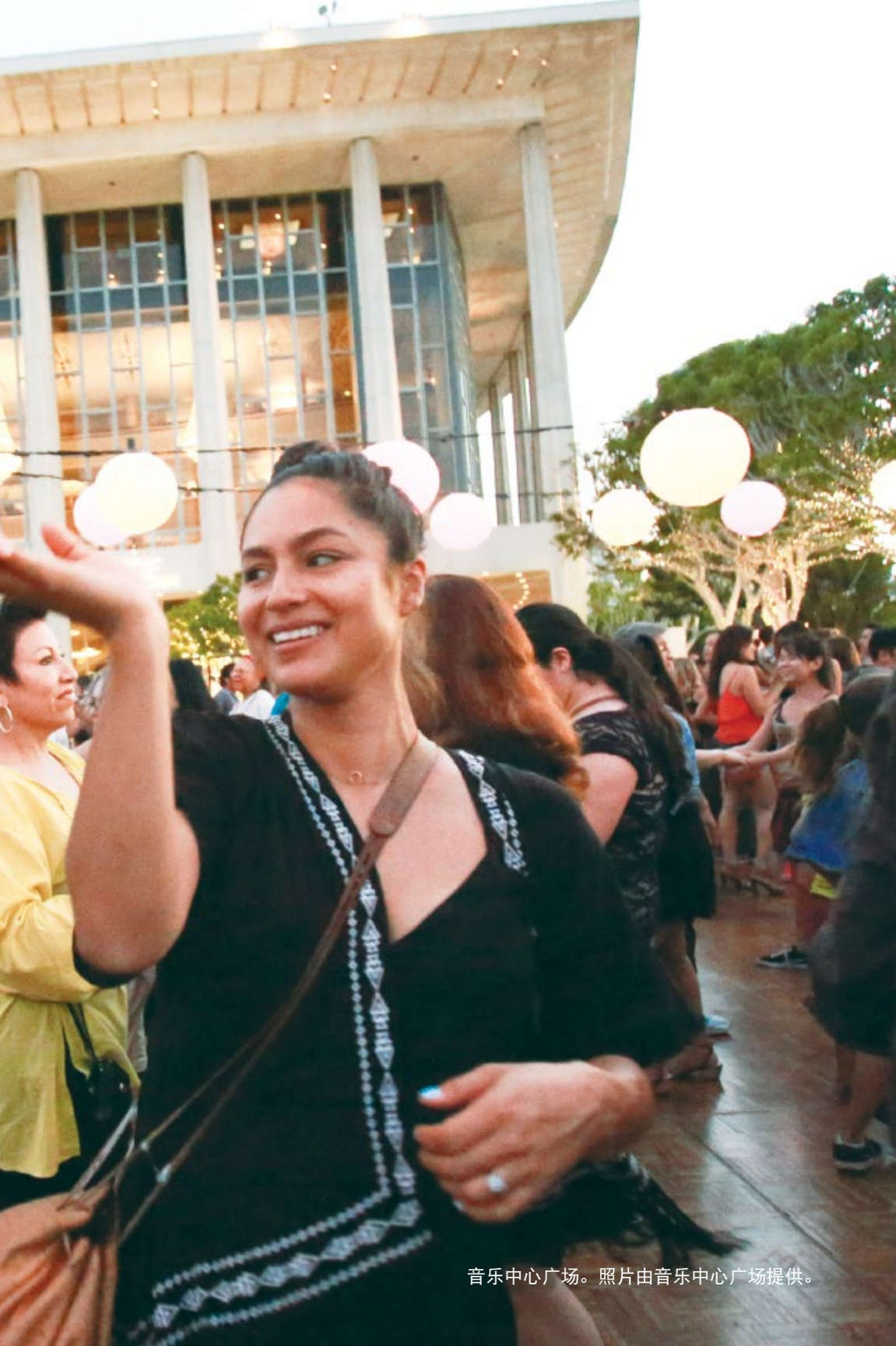
音乐中心广场。